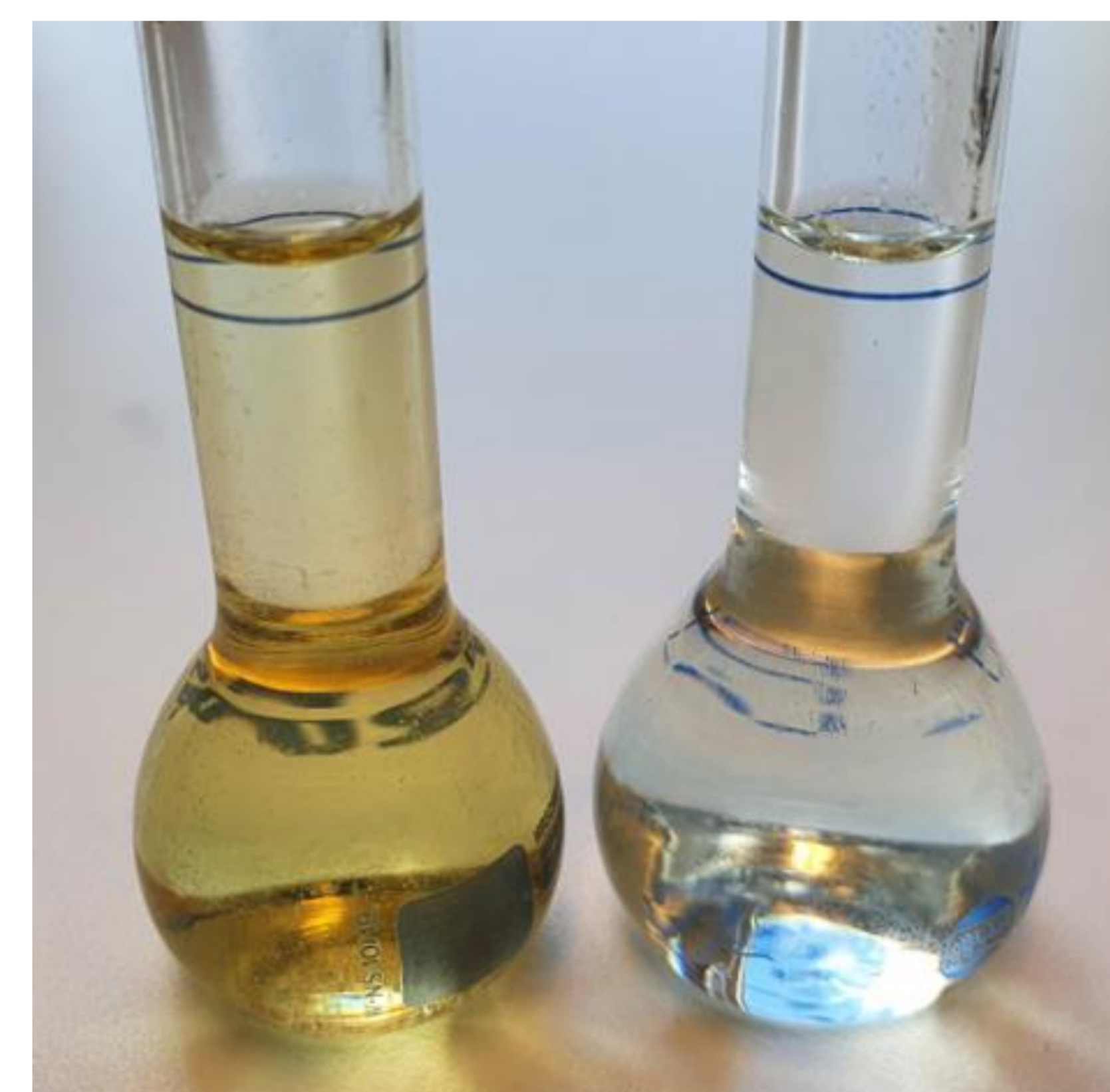
Farge på råolje (til venstre) og raffinert makrellolje (til høyre)