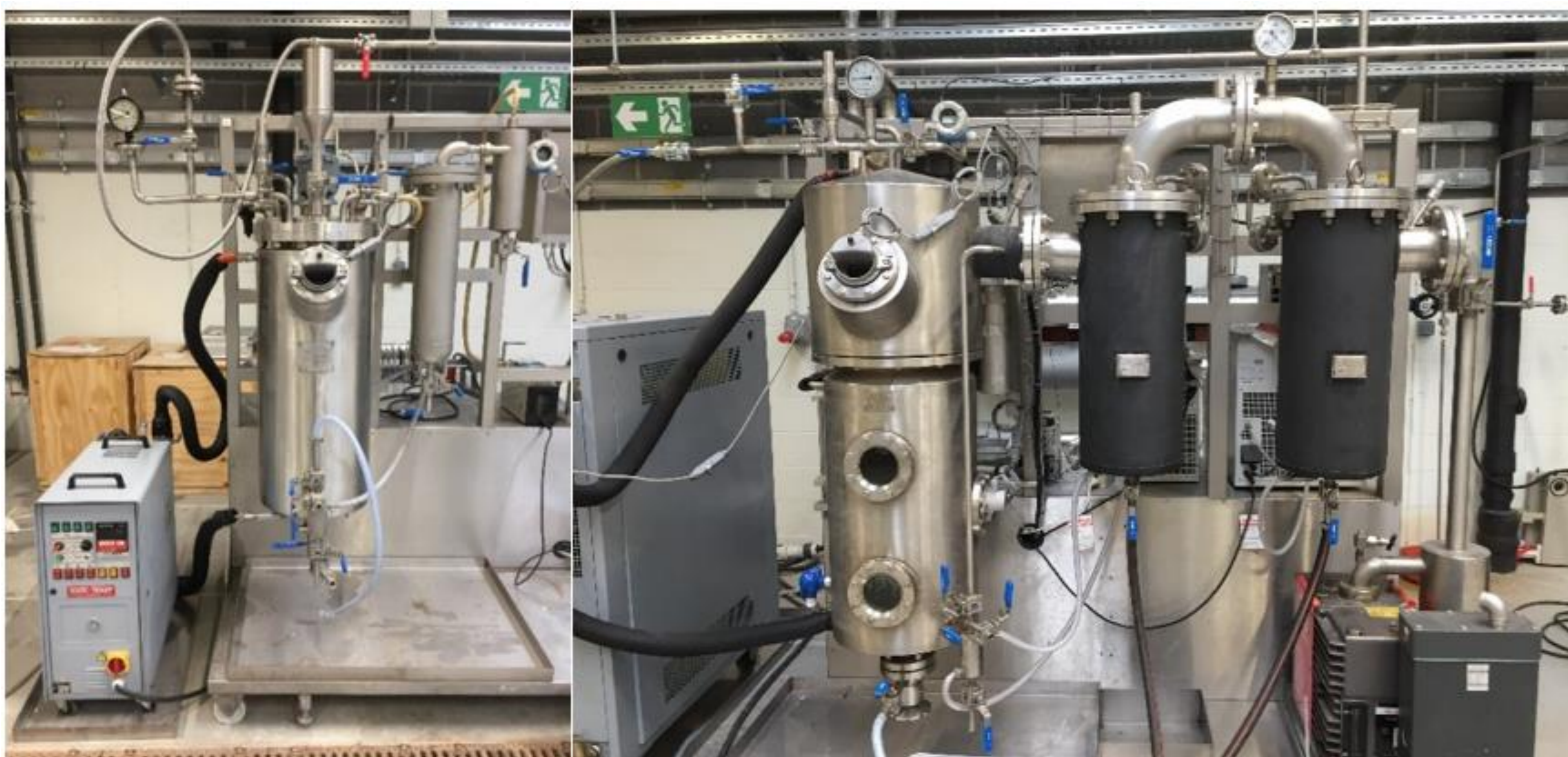
Piloskala raffineringssanlegg som ble benyttet i prosjektet, blekeanlegg (til venstre) og deodorisator (til høyre). (TERRA TRC, Gembloux, Belgia).

Marine oljer med høyt innhold av flerumettede fettsyrer må stabiliseres ved tilsetning av antioksidanter for å unngå oksidasjon (harskning) under lagring. På grunn av strengere regelverk og forbrukerholdninger til anvendelse av syntetiske antioksidanter, går industrien nå mer over til bruk av naturlige antioksidanter som f.eks. tokoferoler og rosmarinekstrakt.